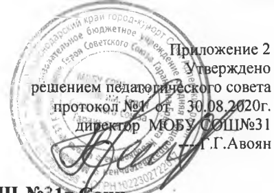
Таблица-сетка часов учебного плана МОБУ СОШ №31г Сочи имени Героя Советского Союза Е.К.Гараньяна для 5-х- классов, реализующих ФГОС основного общего образования в 2020-2021 учебном году