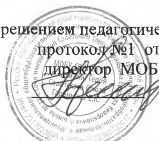
Таблица-сетка часов учебного плана МОБУ СОШ №31 г Сочи имени Героя Советского Союза Е.К.Гараньяна для 3 - 4 -х классов, реализующих ФГОС НОО на 2020– 2021 учебный год